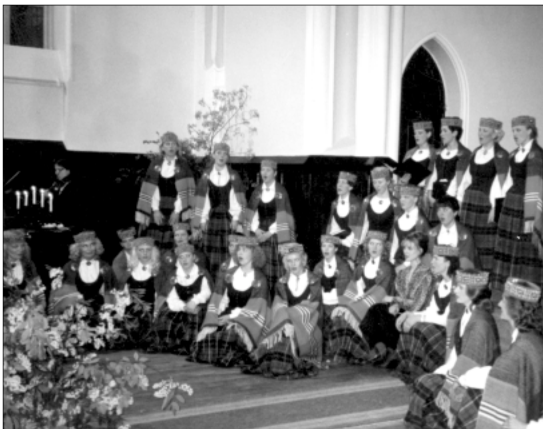
Delta mūzicē RTU Studentu kluba iepriekšējā mājvietā – Anglikāņu baznīcā.

varētu vai kalnus gāzt. Neapšaubāmi – tās dvēseles un garīgās vibrācijas, kuras raisa mūzika, dod spēku Deltas dziedātājiem, no kurām daudzas ir RTU studentes, gan darbam, gan mācībām. □