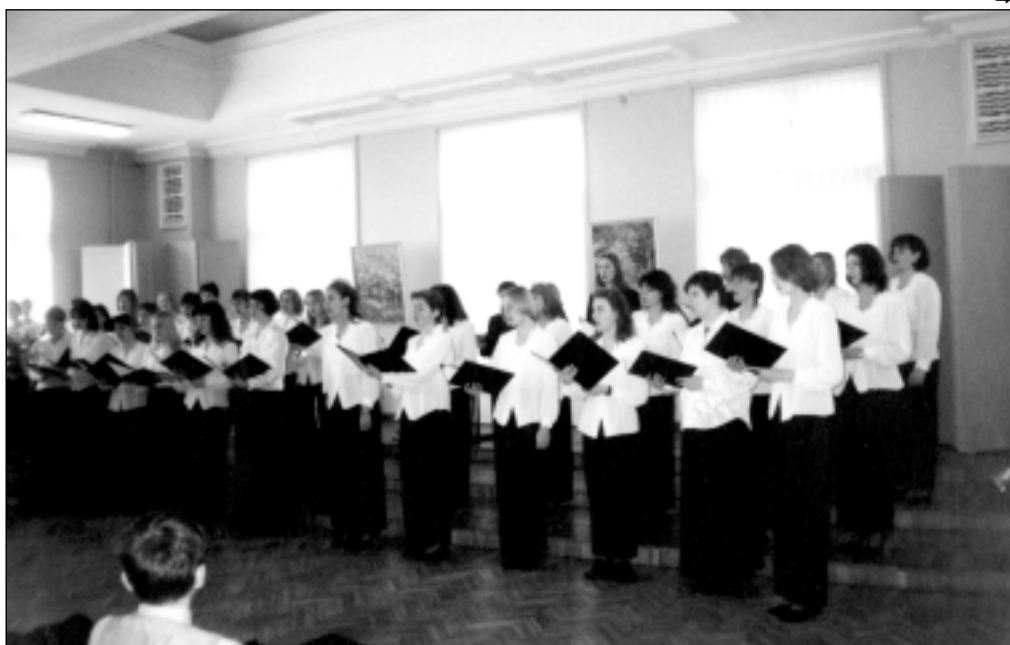
Delta koncertē arī pašu mājās – RTU Mazajā zālē.

Nesot RTU un Latvijas vārdu pasaulē, Delta piedalījusies vairākos nozīmīgos kora mūzikas festivālos. Viens no nozīmīgākajiem panākumiem ir izcīnītais