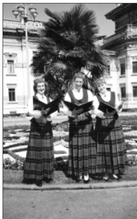
Deltas meitenes Kurzemes novada Lubezeres tautastērpos saulainajā Itālijā, 1998. gads, Dž. Verdi koru konkursa laikā.

tenes izsmidina, izstāstot pa kādai anekdotei. Vislielākais baudījums meitenēm gan ir dziedāšana – tā liek aizmirst nogurumu un visas likstas. Pēc pagaras darba dienas reizēm šķiet – nu nemaz vairs nav spēka, bet pēc mēģinājuma, kas aizskrējis vēja spārnēm, nogurums kā ar roku noņemts un enerģijas tik daudz, ka