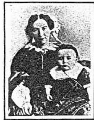
Johann Georg Gustav Kieseritzky