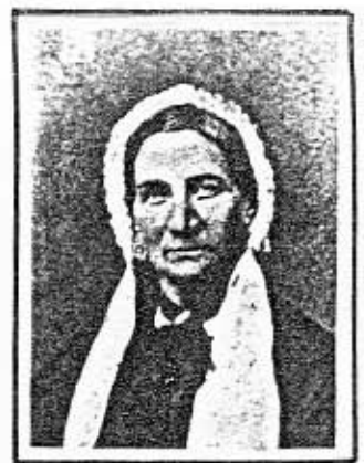
Johann Gustav Kieseritzky